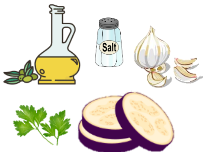
Melanzane al forno