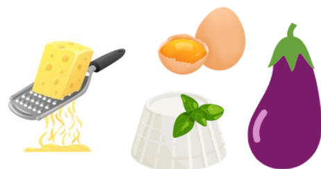
Crocchette di melanzane